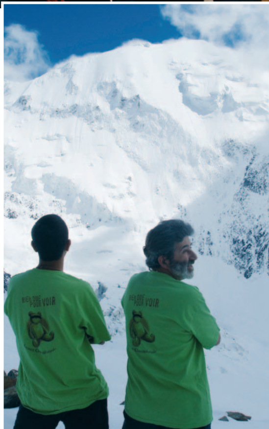
AU REFUGE DE "TÊTE ROUSSE" DANS LE MASSIF DU MONT BLANC