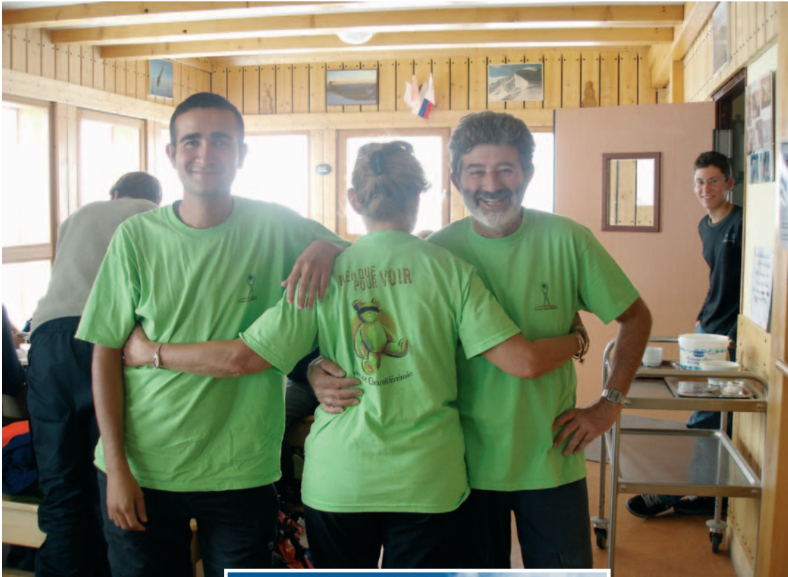
LA CHOROÏDÉRÉMIE EST MONTÉE HAUT ICI 3200 M